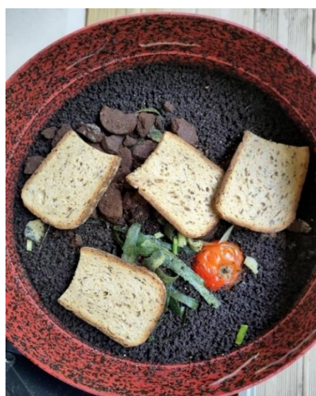
Jour 1 (dépôt de déchets de cuisine)

*Le compost est un engrais constitué d'un mélange de matières organique et minérale dont nitrates et phosphates. Il permet une bonne croissance des plantes dans les cultures.